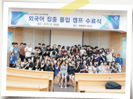
외국어 집중 몰입캠프