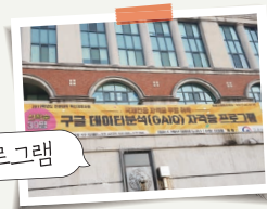
구글 애널리틱스 프로그램

앞으로 미래의 기술들이나 조금씩 발전해 가는 기초적 데이터 지식들을 알려주는 프로그램을 항상 생각 하시면, 구글 애널리틱스 프로그램을 추천 드리고 싶습니다.