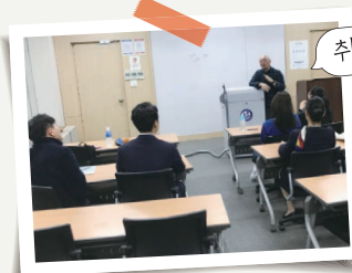
취업동아리 TOSS 토익스피킹

취업동아리는 제가 자격증에 대해 방향을 잡지 못하고 헤매고 있었을 때 방향을 알려준 표지판 같습니다. 동기들, 선배님들과 공부도 하고 추억도 쌓을 수 있었던 취업동아리를 추천합니다.