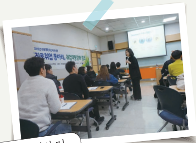
입사서류 작성법 및 유형별 면접 대응 전략