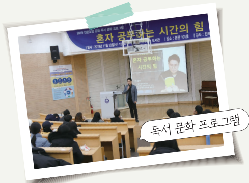
독서 문화 프로그램