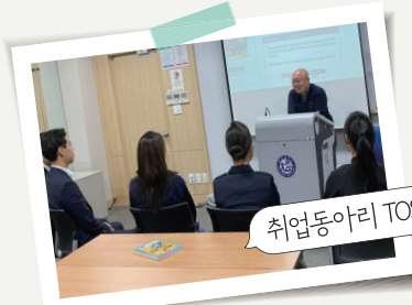
취업동아리 TOSS 토익스피킹